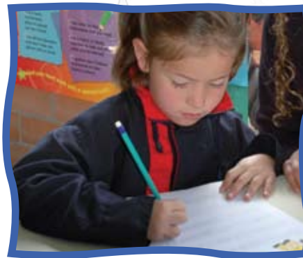
Al finalizar el grado Jardín nuestros niños manejan todo el repertorio de letras y consonantes y disfrutan la lectura y la escritura con el "Programa Letras" que parte de su realidad para "Aprender con Sentido".