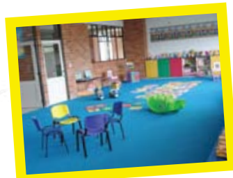
Ludoteca y Salón Exploración de Ciencias.