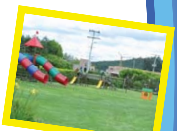
Zonas de juego y parques independientes