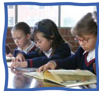
Metodología basada en "Desarrollo de Proyectos" para aprender explorando, pensando, jugando, creando y compartiendo.