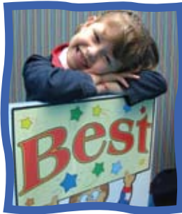
Inmersión bilingüe desde Prejardín.

Nuestro objetivo principal es despertar, motivar y mantener en los niños desde sus primeros años escolares el deseo de aprender, conocer y convivir con otros. Creamos un ambiente cálido y amoroso promoviendo un desarrollo armónico e integral para que en su proceso de crecimiento y progreso se sientan felices.