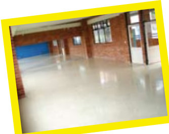
Salón de Danzas