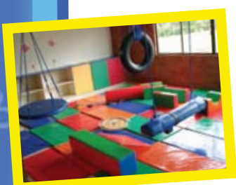
Gimnasio de Estimulación e Integración Sensorial.