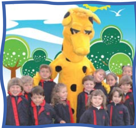
Con la guía de Spotty nuestra mascota, los niños participan en las "Campañas de Convivencia" para interiorizar valores, normas y hábitos.

Nuestro objetivo principal es despertar, motivar y mantener en los niños desde sus primeros años escolares el deseo de aprender, conocer y convivir con otros. Creamos un ambiente cálido y amoroso promoviendo un desarrollo armónico e integral para que en su proceso de crecimiento y progreso se sientan felices.